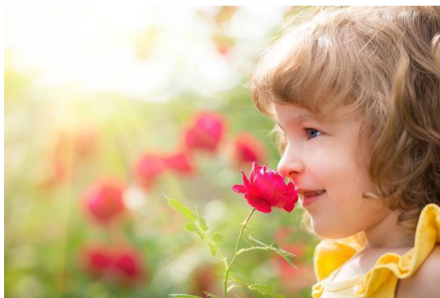
Не все цветы безопасны

Они могут выглядеть красиво и привлекательно, но быть очень опасными для малыша.